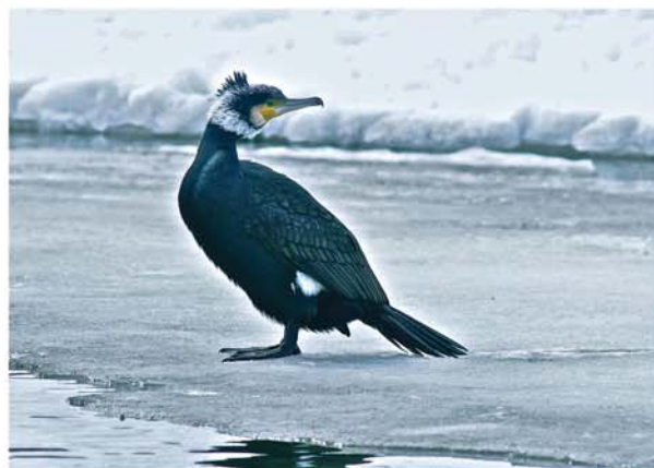
Јован Лакатош - Велики корморан