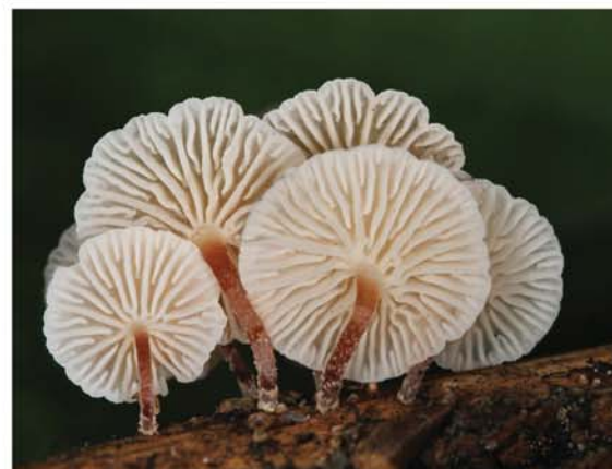
Драгиша Савић - Marasmiellus ramealis

Аутори фотографија су: Јарослав Пап, Јован Лакатош, Јожеф Гергељ, Катарина Пауновић, Геза Фаркаш, Предраг Костин, Драгиша Савић, Владимир Добретић и Дарко Тимотић.