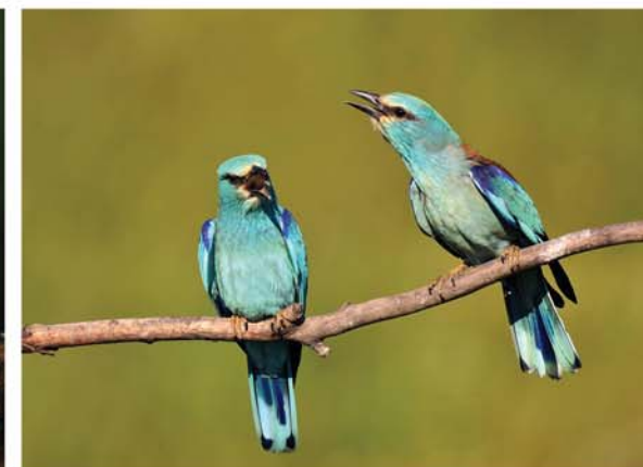
Јожеф Гергељ - Модровране