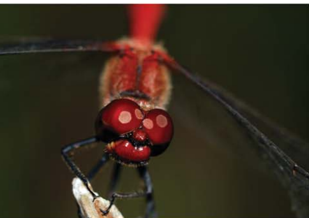
Дарко Тимотић - Вилин коњиц