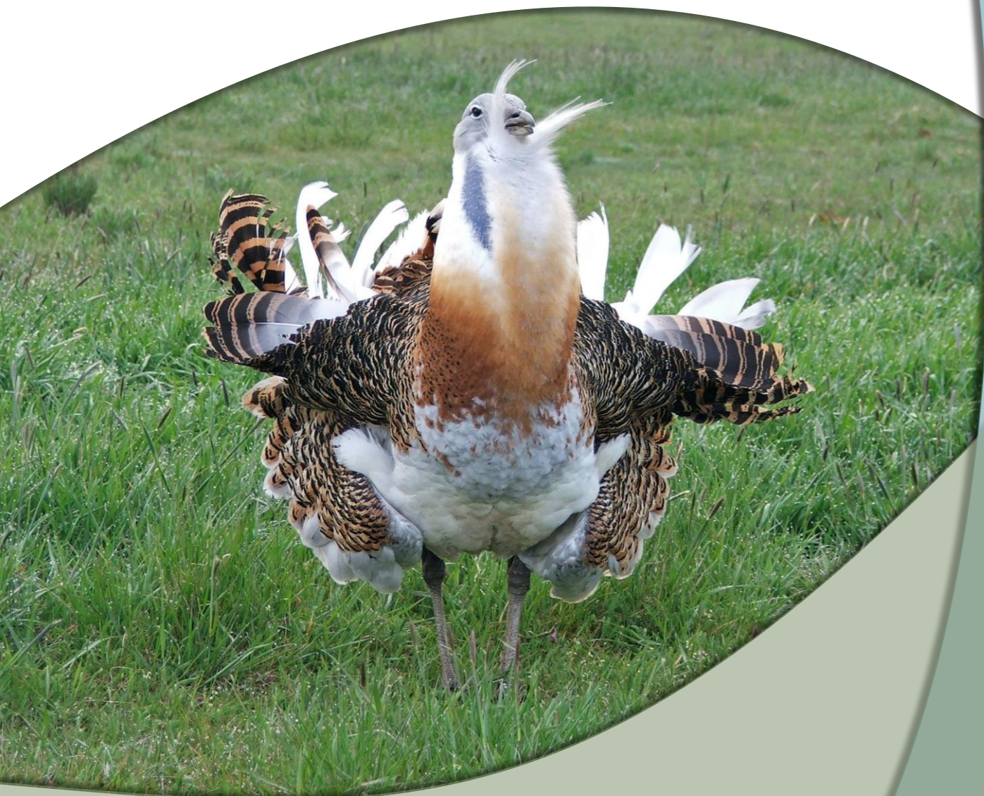
Велика дропља ( Otis tarda )