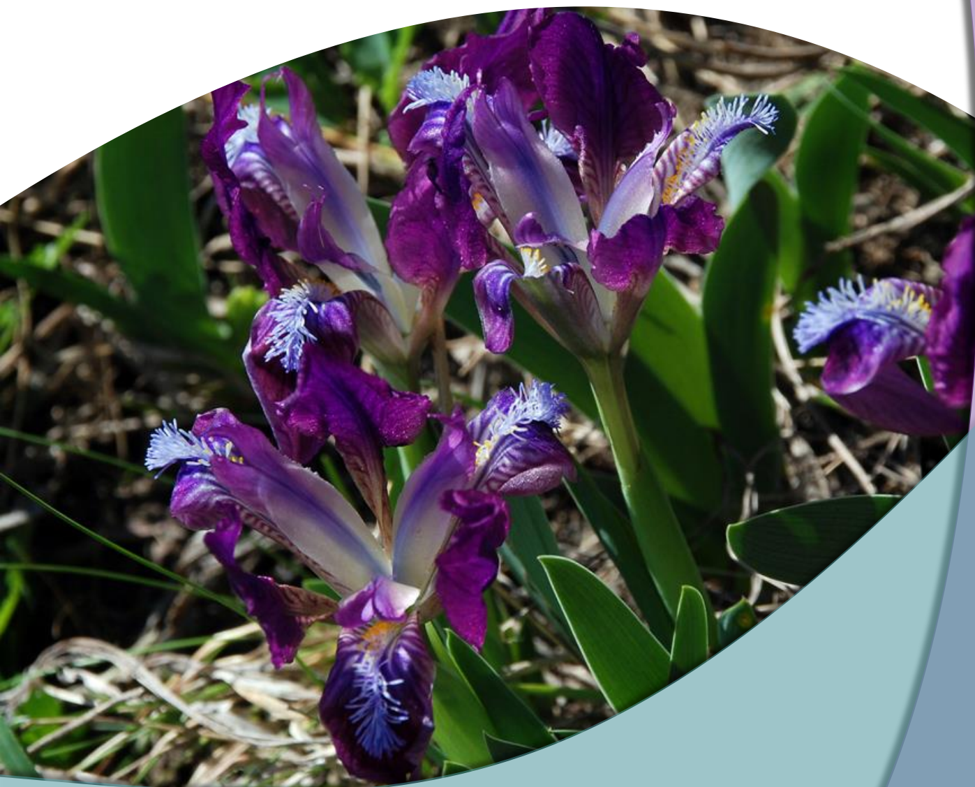
Патуљаста перуника ( Iris pumila L.)