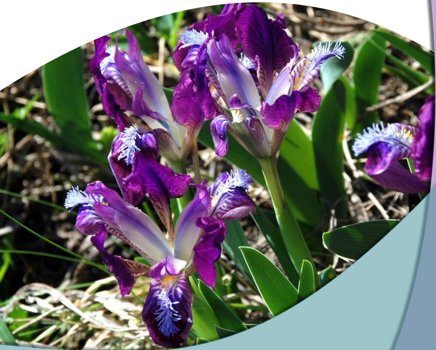
Патуљаста перуника ( Iris pumila L.)